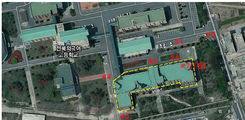
측정 지점 위치(도식도)

「석면안전관리법」 제28조제2항 및 같은 법 시행규칙 제39조제2항에 따라 석면해체·제거 사업장의 석면 비산 측정 결과를 제출합니다.