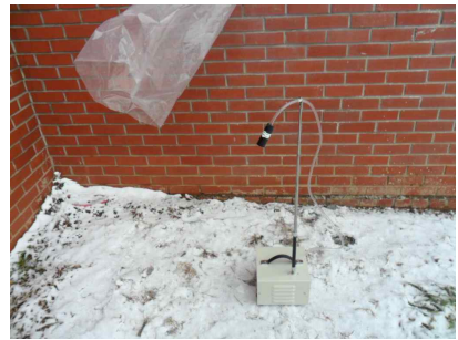
#6 (음압기 공기 배출구)