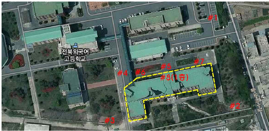
측정 지점 위치(도식도)

「석면안전관리법」 제28조제2항 및 같은 법 시행규칙 제39조제2항에 따라 석면해체·제거 사업장의 석면 비산 측정 결과를 제출합니다.