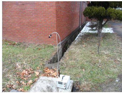
#2 (부지 경계선)