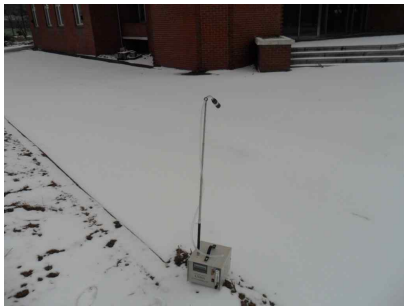
#4 (부지 경계선)