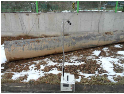
#1 (부지 경계선)