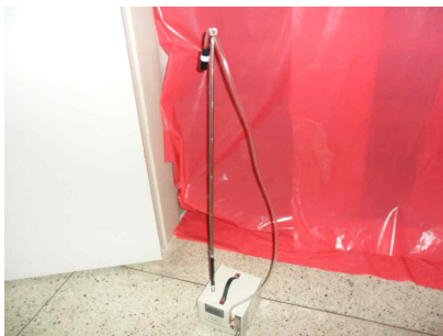
#7 (폐기물 반출구)