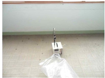
#6 (음압기 공기 배출구)