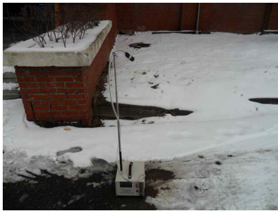
#4 (부지 경계선)