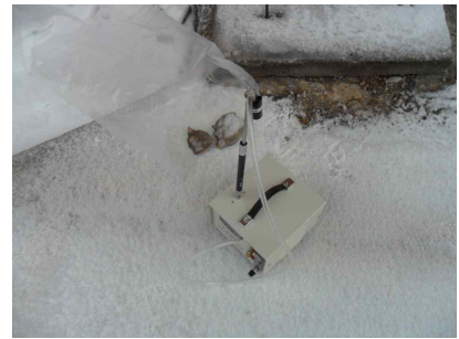
#6 (음압기 공기 배출구)