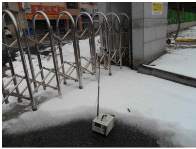
#1 (부지 경계선)