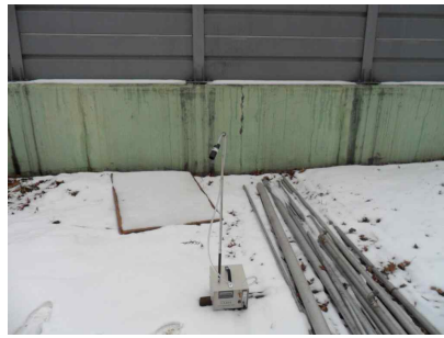
#2 (부지 경계선)