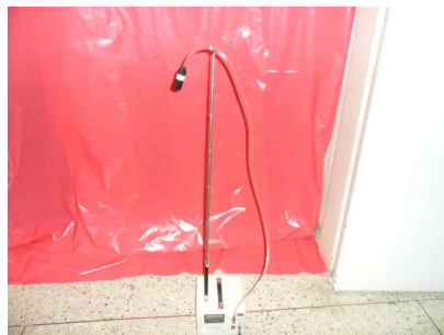
#8 (폐기물 반출구)