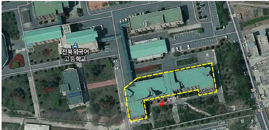
측정 지점 위치(도식도)

「석면안전관리법」 제28조제2항 및 같은 법 시행규칙 제39조제2항에 따라 석면해체·제거 사업장의 석면 비산 측정 결과를 제출합니다.