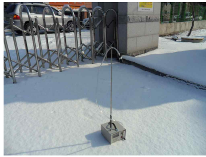
#2 (부지 경계선)