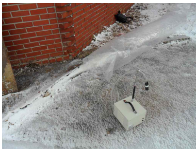
#7 (음압기 공기 배출구)