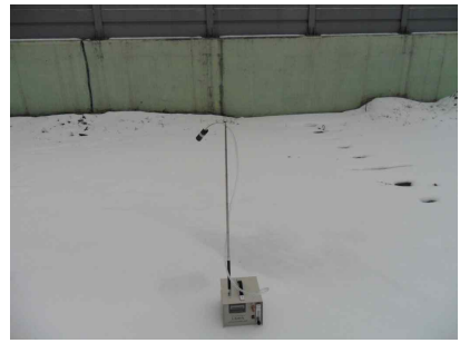
#3 (부지 경계선)