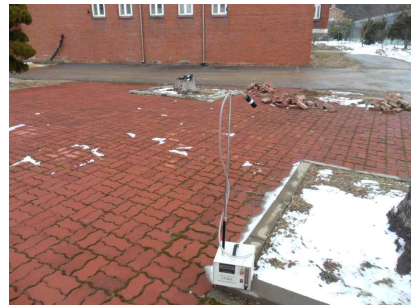
#3 (부지 경계선)