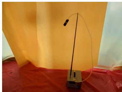
#8 (폐기물 반출구)