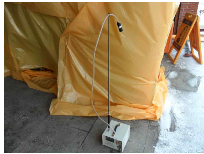
#5 (위생설비 입구)