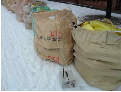
#1 (폐기물 야적지점)