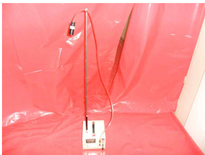
#7 (폐기물 반출구)