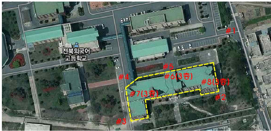
측정 지점 위치(도식도)

「석면안전관리법」 제28조제2항 및 같은 법 시행규칙 제39조제2항에 따라 석면해체·제거 사업장의 석면 비산 측정 결과를 제출합니다.