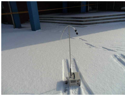
#4 (부지 경계선)