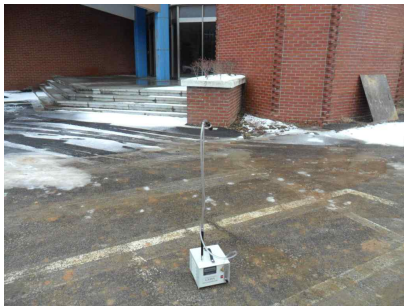
#4 (부지 경계선)