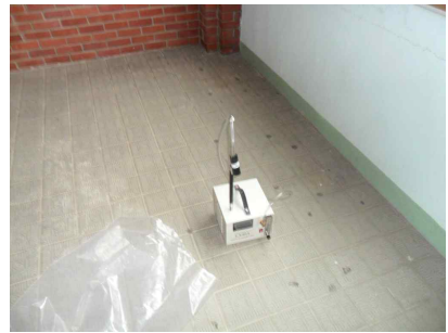
#6 (음압기 공기 배출구)