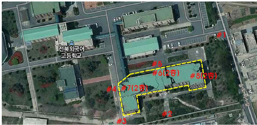
측정 지점 위치(도식도)

「석면안전관리법」 제28조제2항 및 같은 법 시행규칙 제39조제2항에 따라 석면해체·제거 사업장의 석면 비산 측정 결과를 제출합니다.