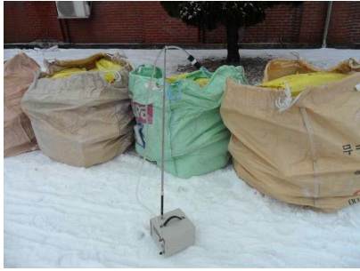
#1 (폐기물 야적지점)