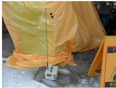
#5 (위생설비 입구)