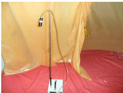
#7 (폐기물 반출구)