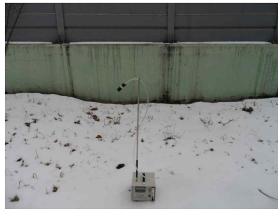
#2 (부지 경계선)