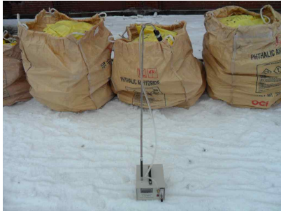
#1 (폐기물 야적지점)