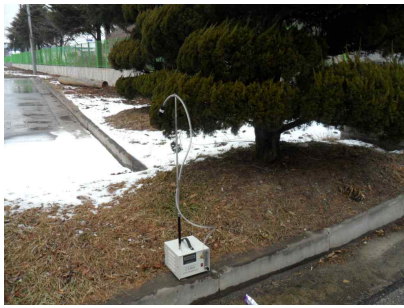
#1 (부지 경계선)