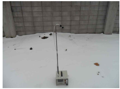
#3 (부지 경계선)