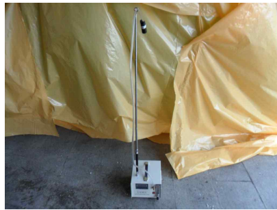
#5 (위생설비 입구)