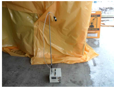
#5 (위생설비 입구)