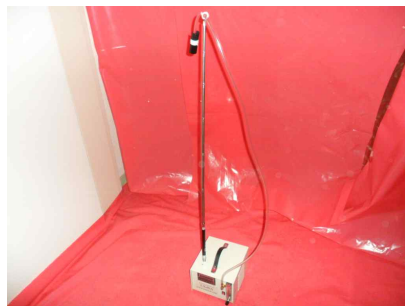
#8 (폐기물 반출구)