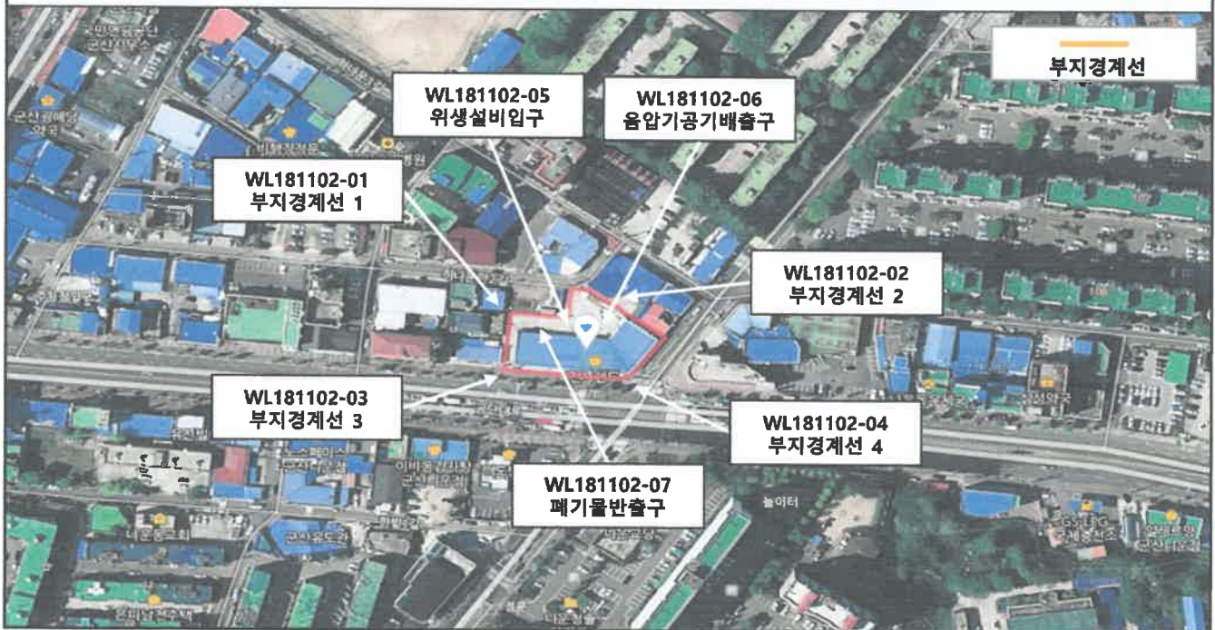
측정 지점 위치 도식도

「석면안전관리법」제28조제2항 및 같은 법 시행규칙 제39조제2항에 따라 석면해체·제거 사업장의 석면 비산 측정 결과를 제출합니다.