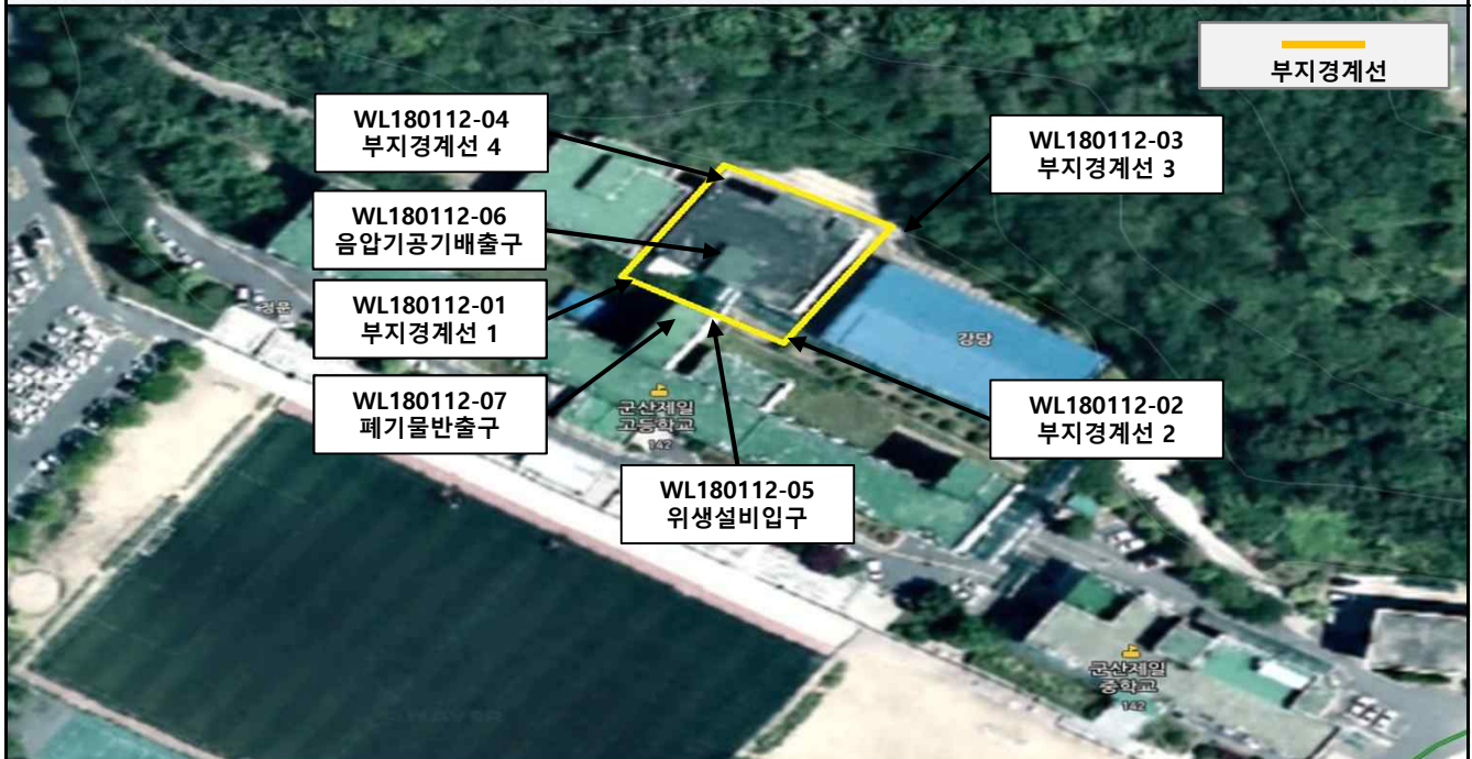
측정 지점 위치 도식도

「석면안전관리법」제28조제2항 및 같은 법 시행규칙 제39조제2항에 따라 석면해체·제거 사업장의 석면 비산 측정 결과를 제출합니다.