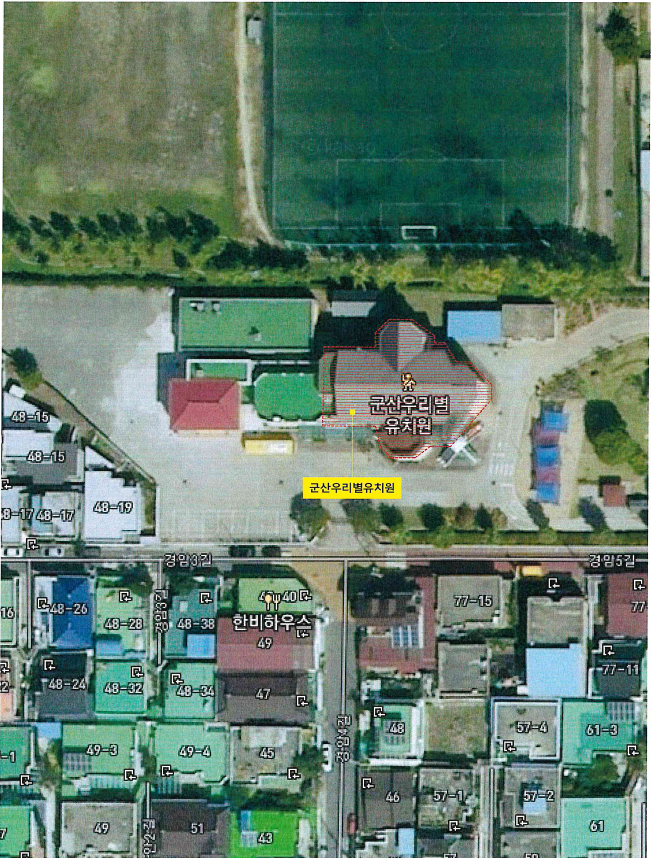
측정 건물 위치도