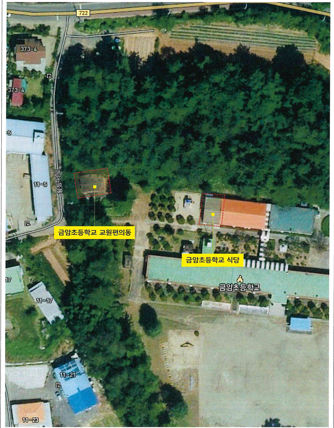
측정 건물 위치도