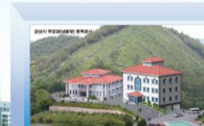
▲추모관 증축 사업

공시내용으로는 공통공시와 재정운영 결과를 공시하는 특수공시로 나뉘게 된다. 특수공시사업은 시립도서관 건립, 예술회관 건립사업, 은파 자전거도로개설, 추모관 증축 등을 포함하여 지방재정공시심의위원회를 거쳐 13건이 선정되었다. 공시내용은 읍면동 주민센터 및 시 홈페이지에서 열람 할 수 있다.