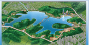
▲은파 자전거도로 개설 사업

재정운영고시는 우리시 1년 동안의 재정 운영결과와 주민의 관심사항등을 객관적인 절차를 통해 누구나 알기 쉽도록 공개하는 제도로 공시대상은 2008년도 재정운영 결과이다.