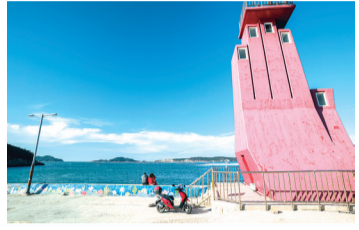
섬과 섬 사이를 달린다. 신시도에서 장자도까지