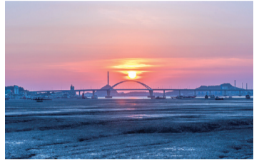
강변 따라 달리는 두 바퀴 감성! 금강생태습지공원부터 시비공원까지