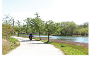
도심 속에서 여유를 느낀다. 은파호수공원