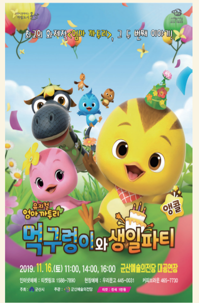
뮤지컬 엄마까투리 먹구렁이와 생일파티 11월 16일(토) 11시, 14시, 16시 / 대공연장

* 상기 일정은 변경될 수 있으며, 세부 내용은 군산예술의전당 홈페이지( http://arts.gunsan.go.kr )를 참고하시기 바랍니다.