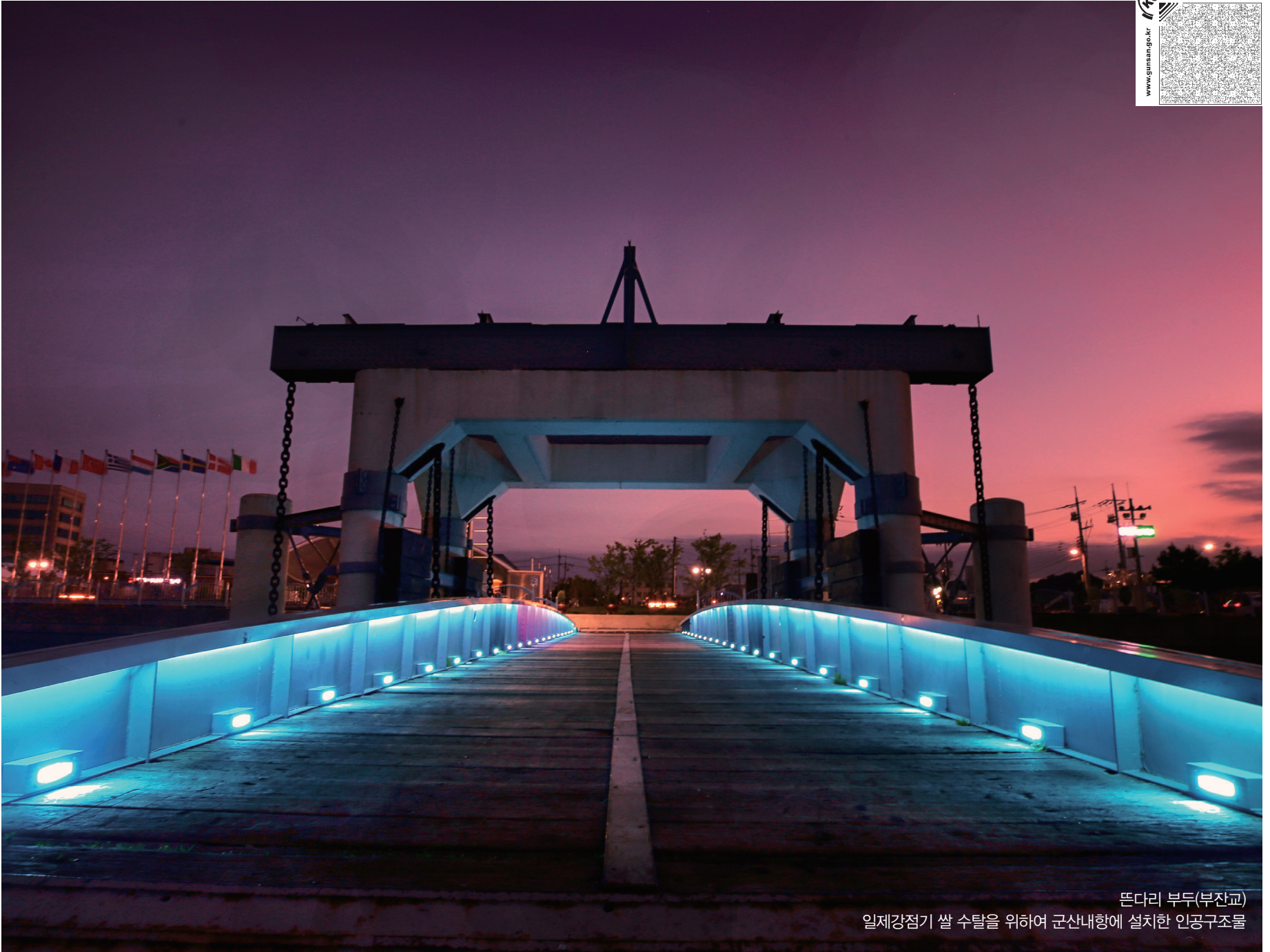
뜯다리 부두(부잔교) 일제강점기 쌀 수탈을 위하여 군산내항에 설치한 인공구조물