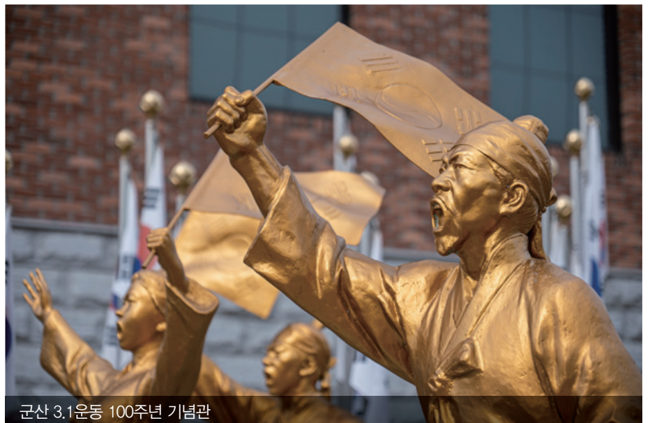
군산 3.1운동 100주년 기념관