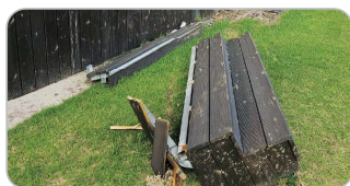
축제장 시설 파손