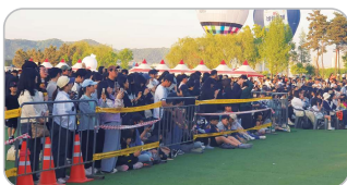
인파 밀집 우려