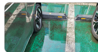
충전구역 위험요소(침수 우려 등)