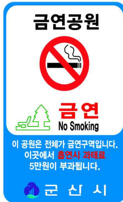
나. 공원 금연구역