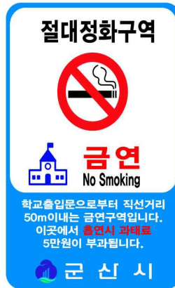
다. 절대정화구역 금연구역