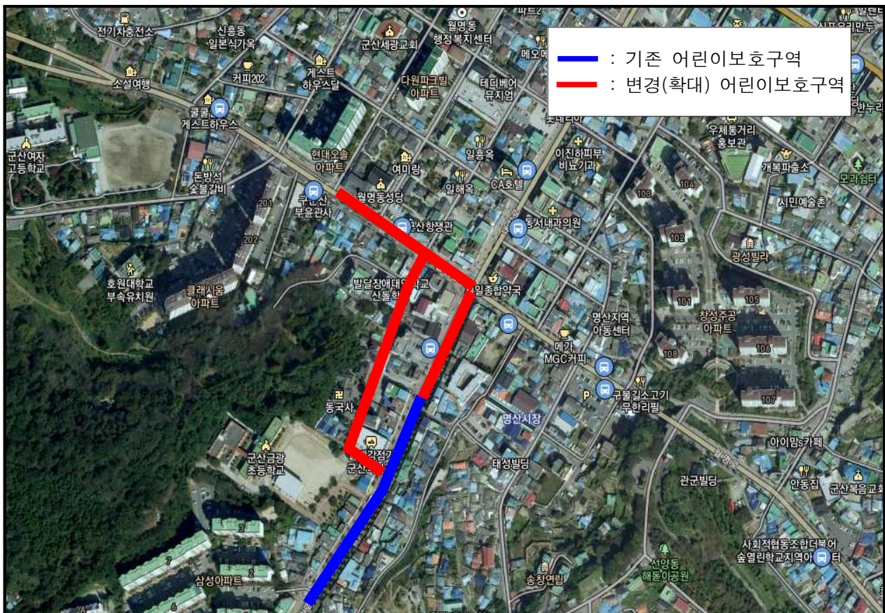
군산금광초등학교 어린이보호구역(군산시 금광동 168번지 일원)