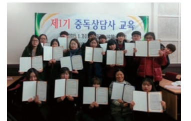
중독 상담사 과정 교육