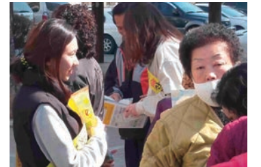
이동상담 및 캠페인