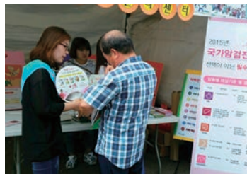
암 홍보 캠페인