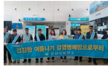
건강한 여름나기 손씻기 캠페인