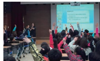
지역아동센터연계 감염병 예방 교육