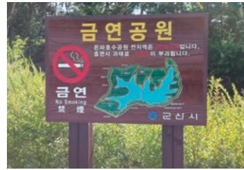
금연 표지판 설치