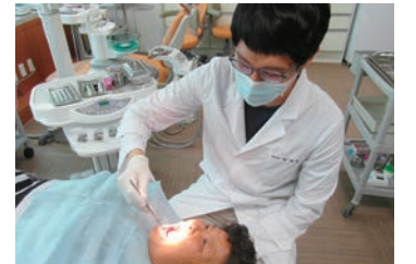
노인 무료 의치 틀니사업