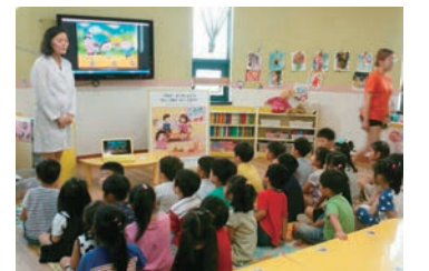
아토피 바로알기 교실