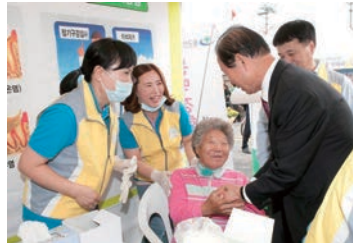
시민의날 구강부스 운영