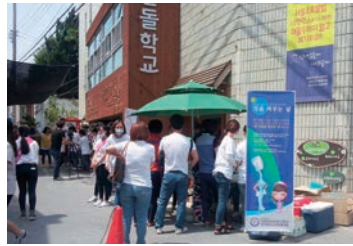
칫솔 바꾸는 행사