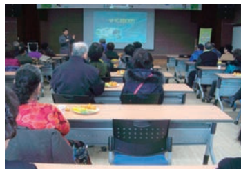
전북지역 암센터 연계 암 예방교육