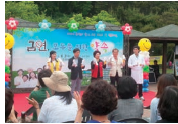
세계 금연의 날 행사