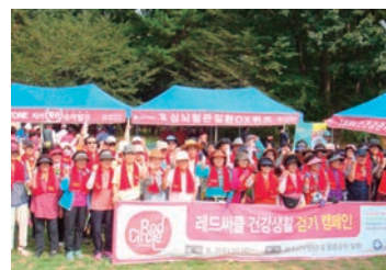
레드써클 건강생활 걷기 캠페인