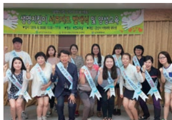
자살예방 상담자 양성 세미나(게이트키퍼)