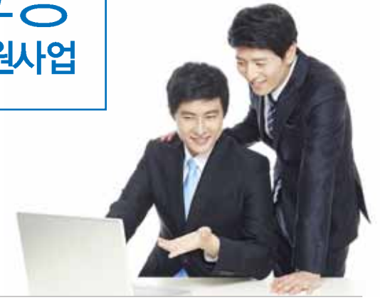
새만금 - 기업고용지원센터