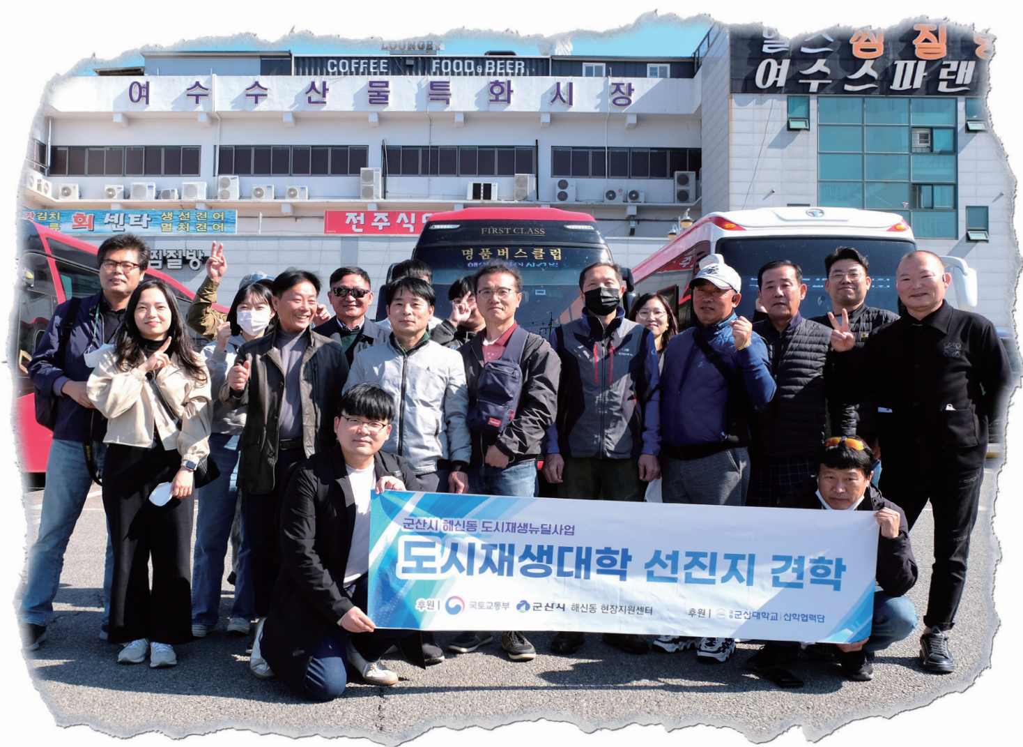
해신동 도시재생뉴딜사업 도시재생대학 여수 선진지 견학