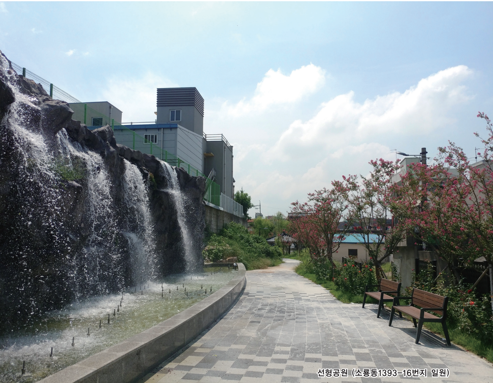
선형공원 (소룡동1393-16번지 일원)