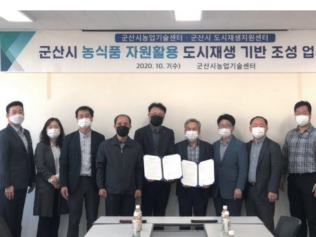
5. 군산시 농업기술센터와 업무협약식_`20.10