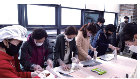
8. 할매맥아박강정 체험