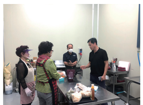
3. 농업기술센터 컨설팅_`20.09