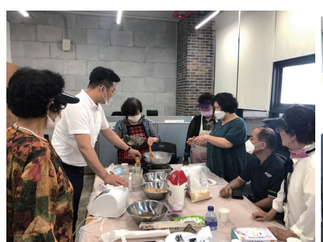
4. 장항 강정 장인 기술 전수_`20.09