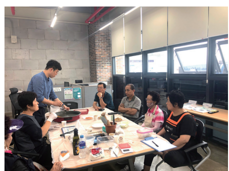
1. 시제품 제작_`20.07.-12.(매주 목요일)

2022년 재보선창협동조합에게는 중요한 한 해가 될 것이다. 전문가들의 컨설팅을 통해 신규 품목 및 새로운 작업 방식도 논의해 봐야 하며, 새로운 인재도 발굴하여 젊은 사무장을 유치, 전북 최초 도시재생형 마을기업이라는 타이틀이 무색하지 않도록 재보선창협동조합과 중앙동 도시재생현장지원센터는 원팀이 되어 뚜벅뚜벅 주민들의 지속 가능한 마을기업을 위해 함께 나아갈 것이다.