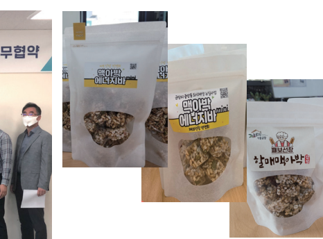
6. 맥아박에너지바(mini) 1-3차시 시제품 완성품