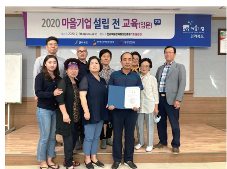
2.설립 전 교육_`20.07.