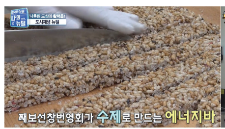
7. 방송 출연 - KTV N의 뉴딜 - SBS 뉴스토리 도시재생 우수사례 - SBS BIZ 나태주가 간다