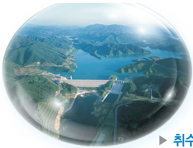
▶ 취수원 용담댐 전경