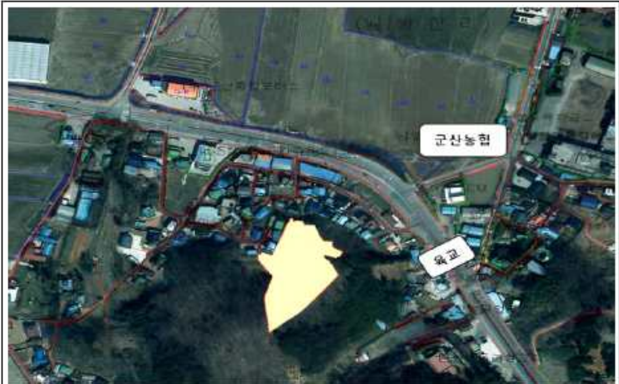
위치도(개정면 발산리 103-21번지 일원)