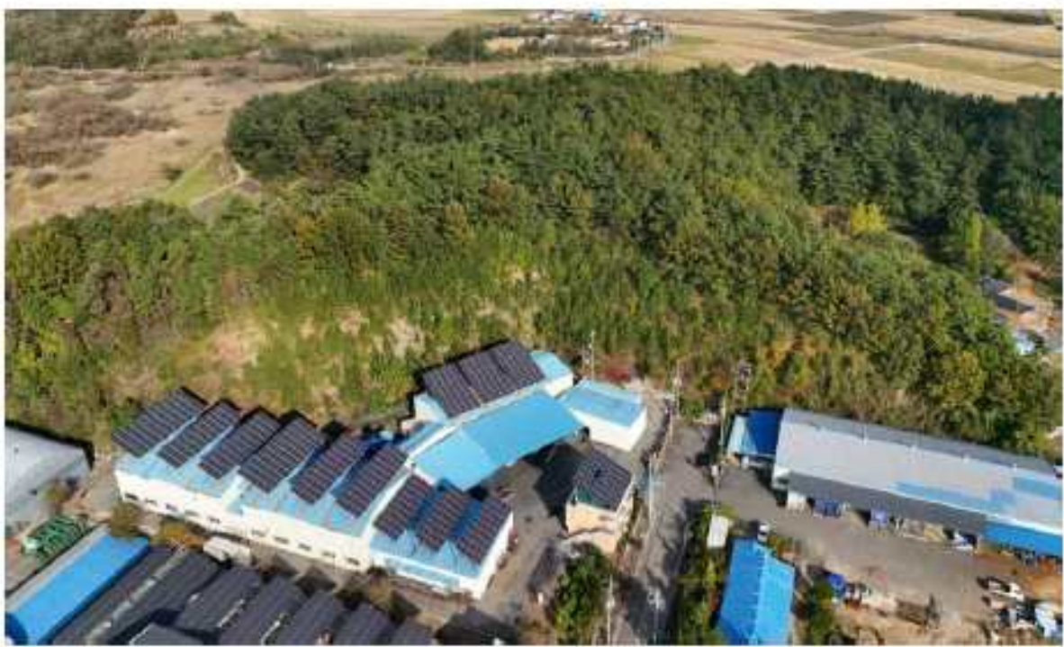
현 장 사 진