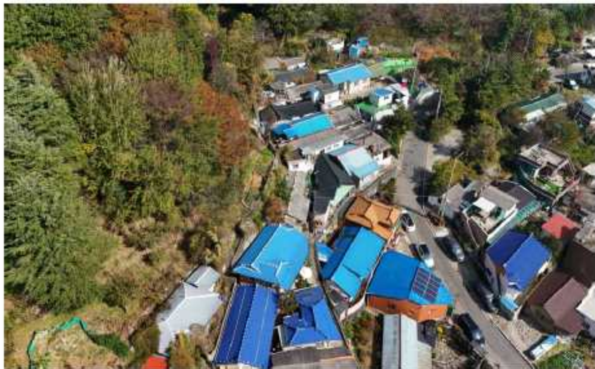
현 장 사 진