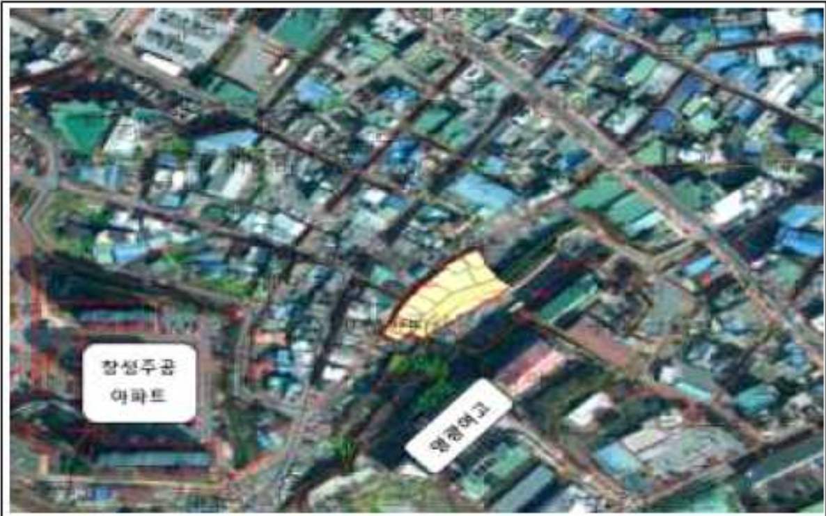
위치도(개복동 13-3번지 일원)