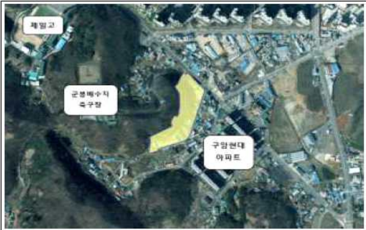
위치도(구암동 63-6번지 일원)