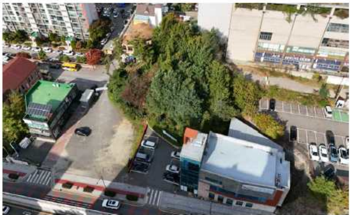
현 장 사 진