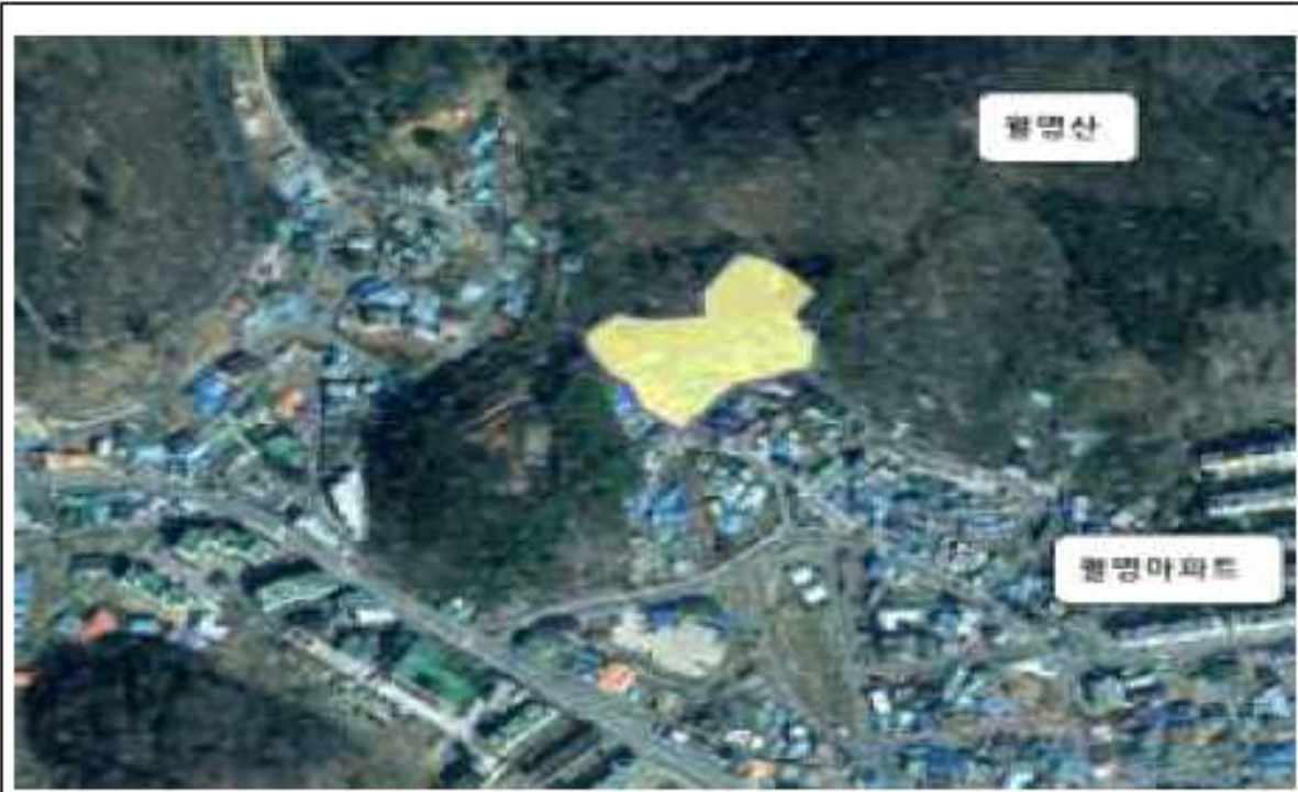
위치도(송풍동 977-2번지 일원)