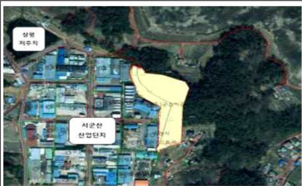
위치도(옥구읍 상평리 산63-1번지 일원)