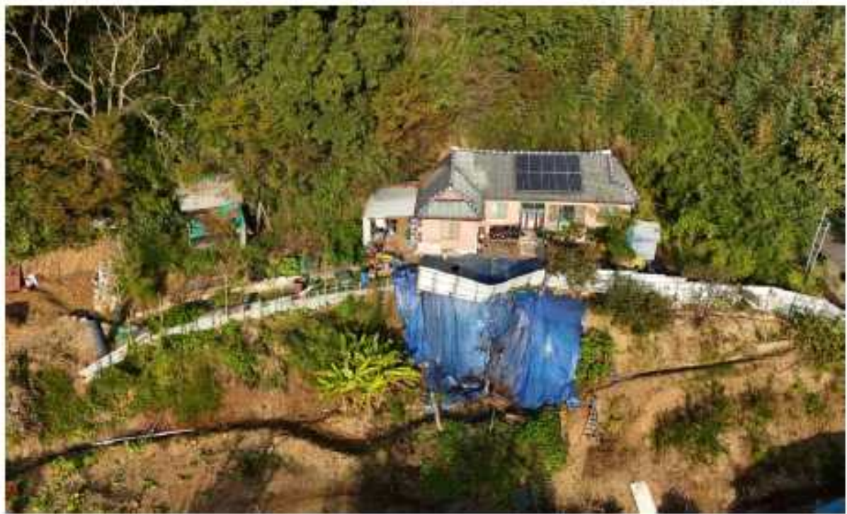
현 장 사 진