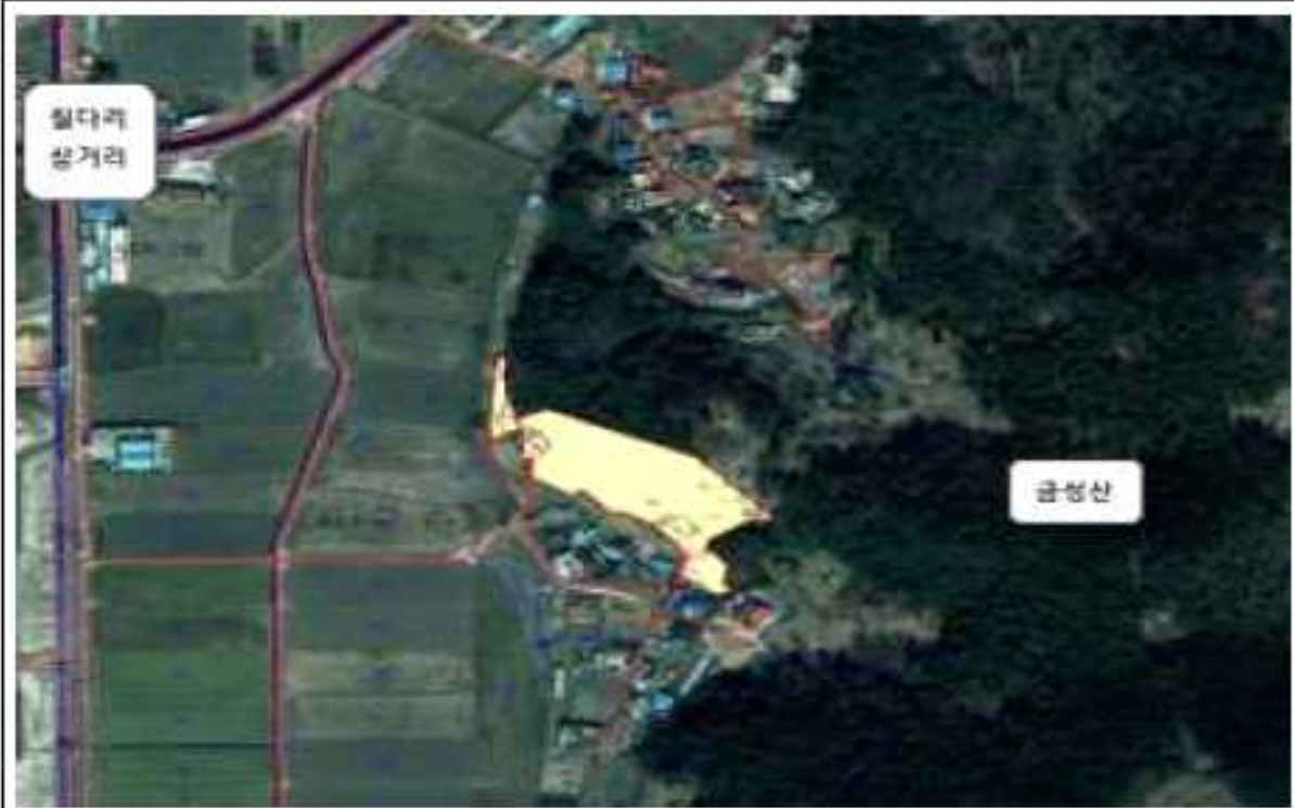
위치도(옥산면 금성리 245-1번지 일원)