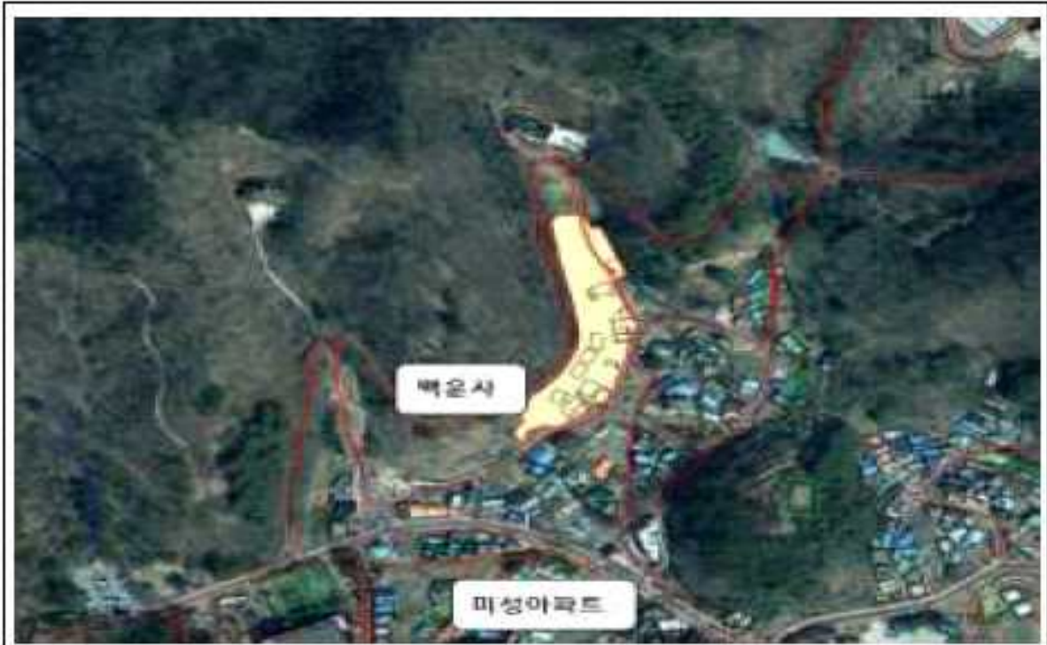
위치도(송풍동 958-25번지 일원)