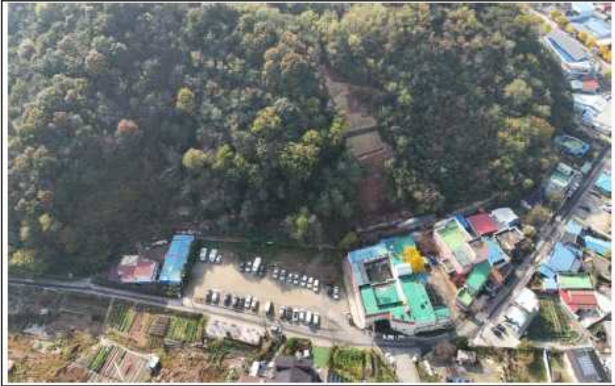
현 장 사 진