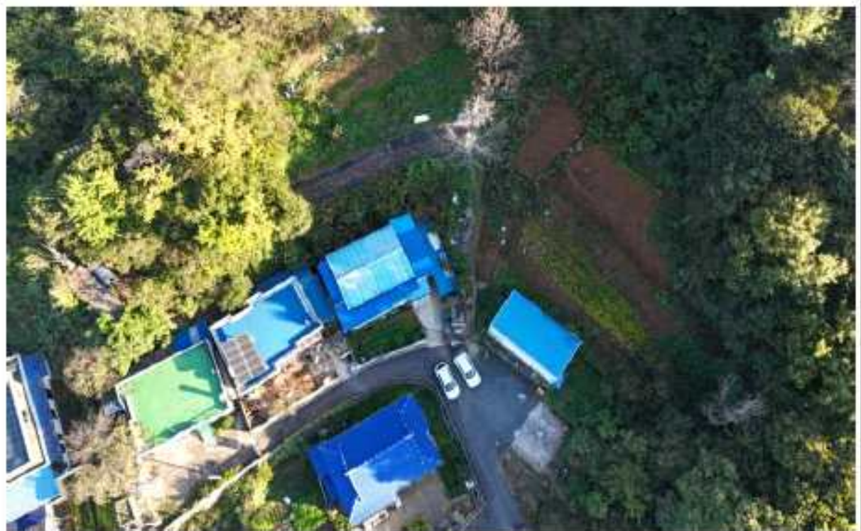
현 장 사 진