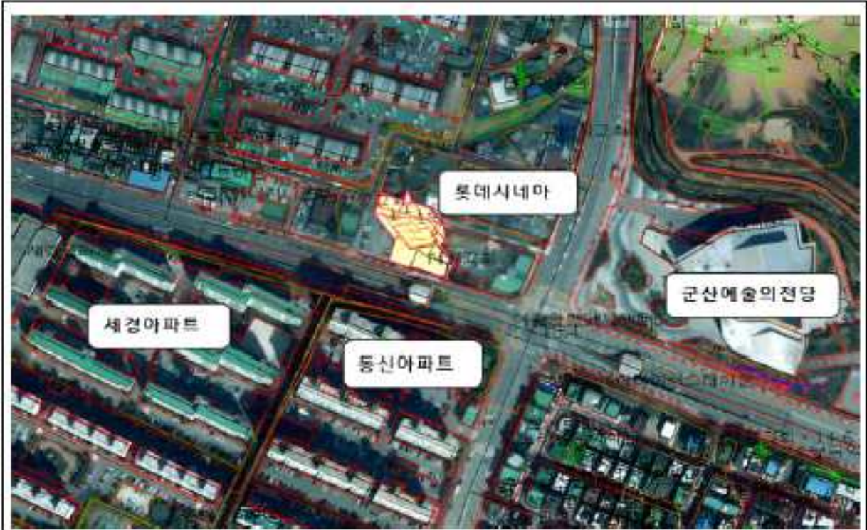
위치도(나운동 114-45번지 일원)