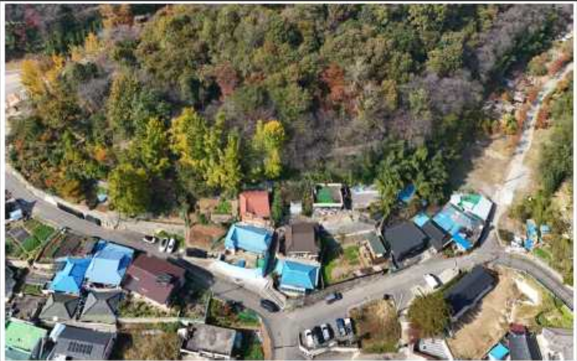
현 장 사 진