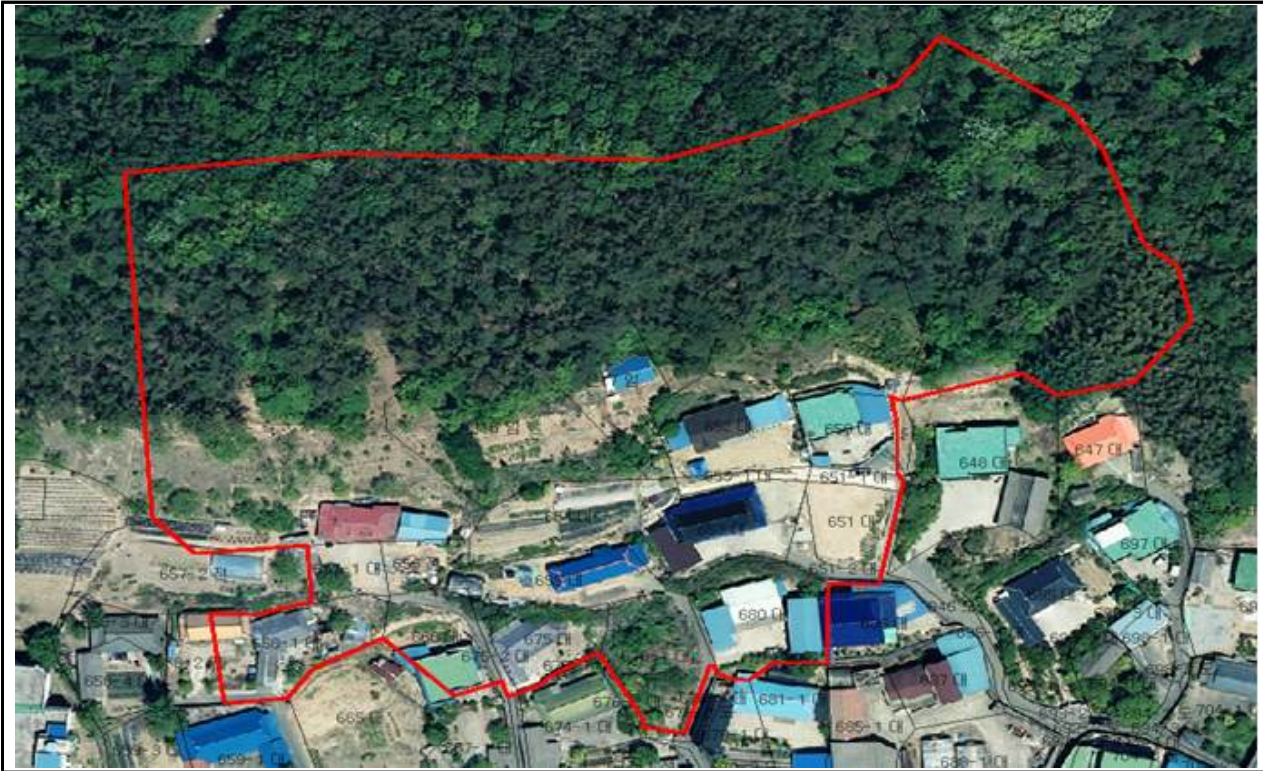
위 치 도 (대야면 죽산리 666번지일원)