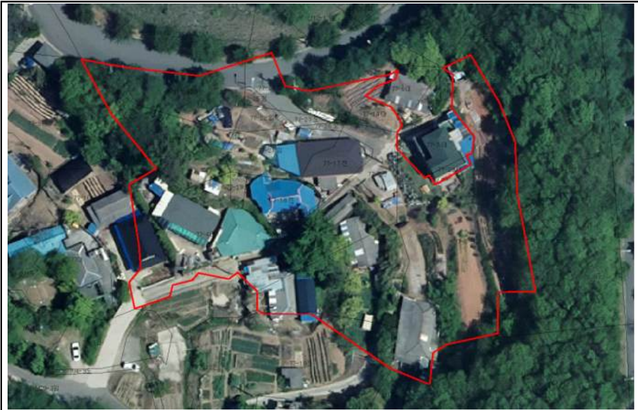
위 치 도 (조촌동 77-17번지일원)