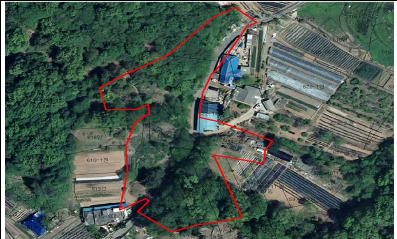
위 치 도 (개정동 산54번지일원)