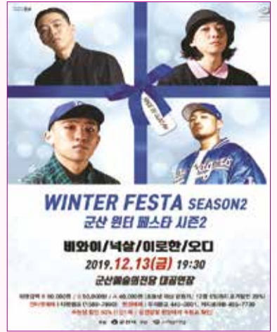
WINTER FESTA SEASON2 12월 13일(금) 오후 7시 30분 / 대공연장