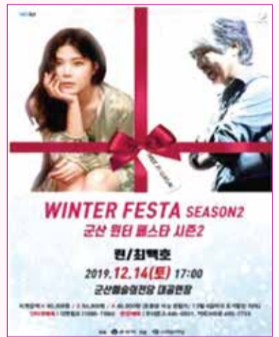
WINTER FESTA SEASON2 12월 14일(토) 오후 5시 / 대공연장