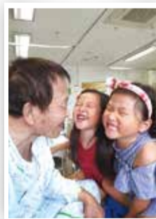
외할아버지 웃음 찾기