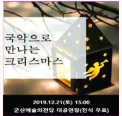
국악으로 만나는 크리스마스 12월 21일(토) 오후 3시 / 대공연장

* 상기 일정은 변경될 수 있으며, 세부 내용은 군산예술의전당 홈페이지( http://arts.gunsan.go.kr )를 참고하시기 바랍니다. 군산예술의전당 ☎ 063-454-5520,5530