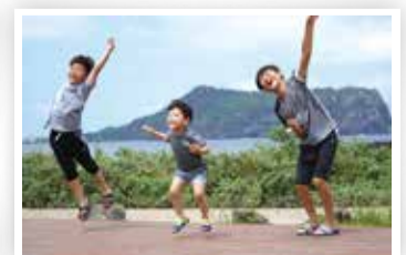
삼형제 하늘로 날다