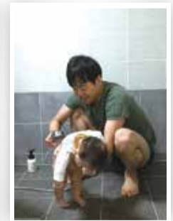
내 아들은 소중한니까!