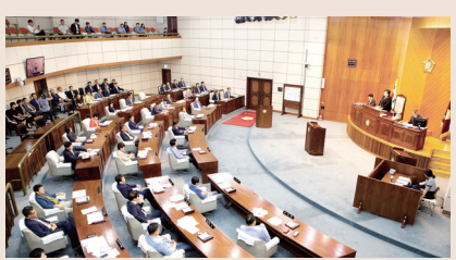
제209회 제1차 정례회에서 심의한 부의안건은 다음과 같다.

한편 6.13 지방선거 당선자들로 구성된 제8대 군산시의회는 7월 3일 의장단 선출 및 개원식을 갖고 본격적인 의정활동에 들어갈 예정이다.