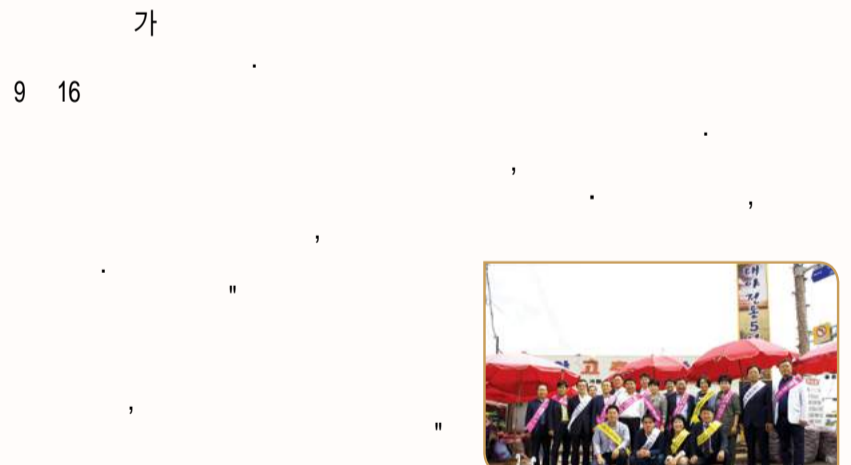
대야 전통시장 장보기 캠페인