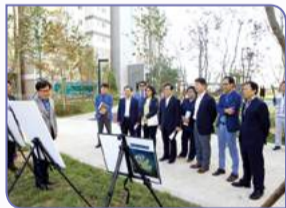
행복위 - 새만금지구 내부개발사업 현장 경건위 - 해망동 보금자리 주택 현장