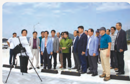
■ 경제건설위원회 - 야미도 어촌관광단지 조성현장