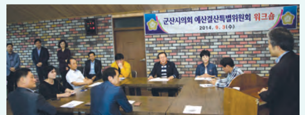
■ 예산결산특별위원회, 제2차 추경 예산안에 대한 설명을 청취

예산결산특별위원회는 9월 3일 제2차 추경 예산안 심의를 앞두고 예결위원들의 전문역량 강화를 위해 워크숍을 개최해, 시민의 혈세가 헛되게 낭비되는 일이 없도록 하겠다고 다짐했다.