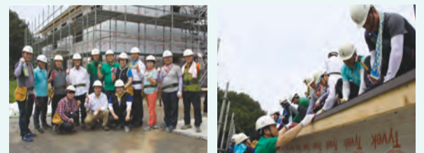
■ 군산시 성산면 둔덕리 해비타트 '사랑의 집짓기' 봉사활동

환경봉 부의장은 “새로운 희망을 가지고 보금자리를 마련하게 될 가족들의 모습을 생각하니 절로 흐뭇해진다”며 “앞으로도 어려운 이웃과 함께하는 참봉사를 실천하고 사랑 나눔을 통해 서민들이 좀 더 행복한 삶을 살아갈 수 있도록 군산시의회가 솔선수범 하겠다”고 다짐했다.