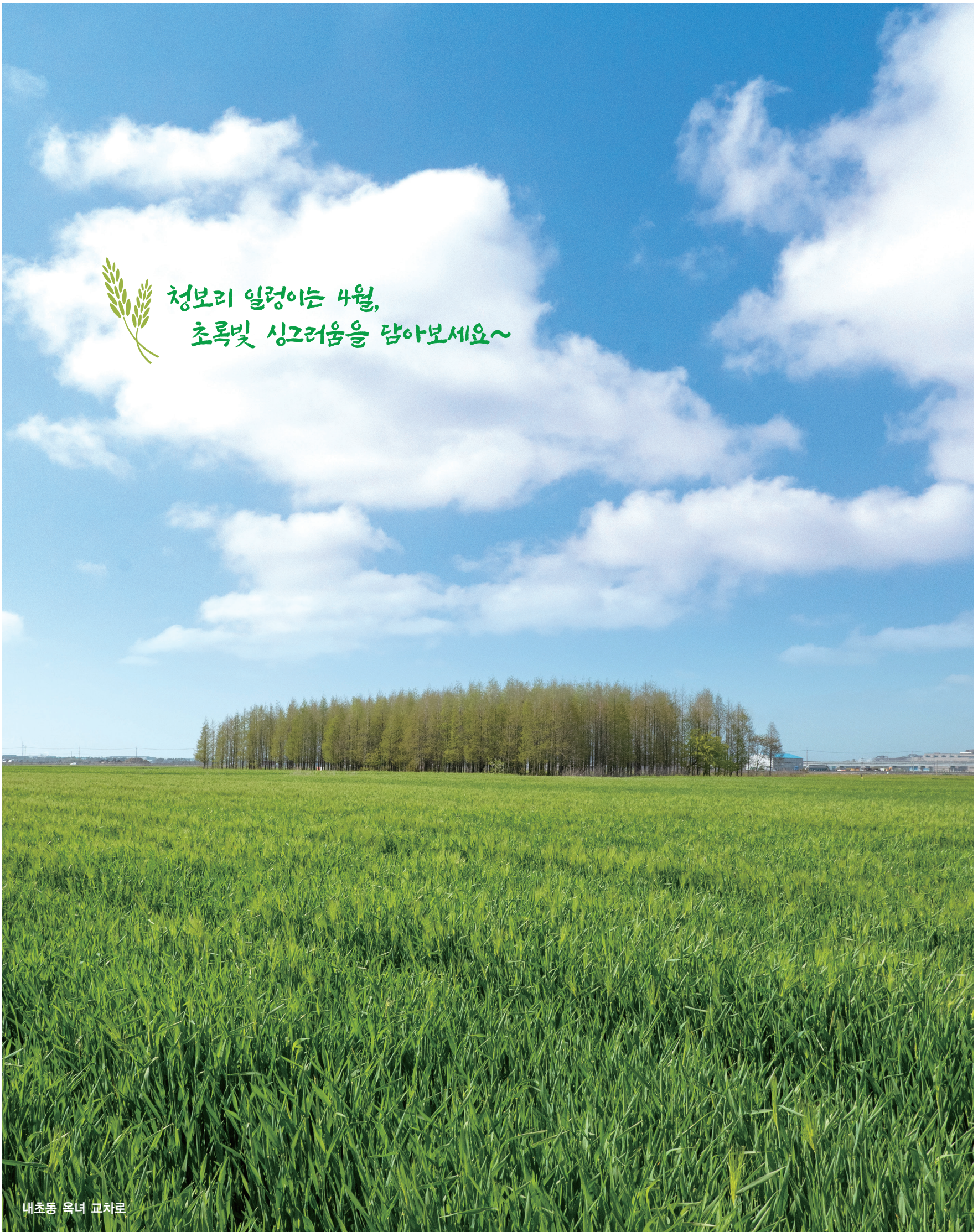
내초동 옥녀 교차로

통 권 제289호 발행일 2021.4.25. 발행인 군산시장 발행처 군산시청 공보담당관 군산시 시청로 17(조촌동) T.063-454-2092 www.gunsan.go.kr