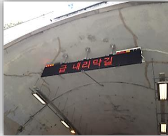
터널 전광판 위 경광등