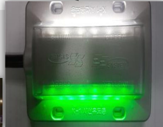
LED시선유도등 (KTR 인증)