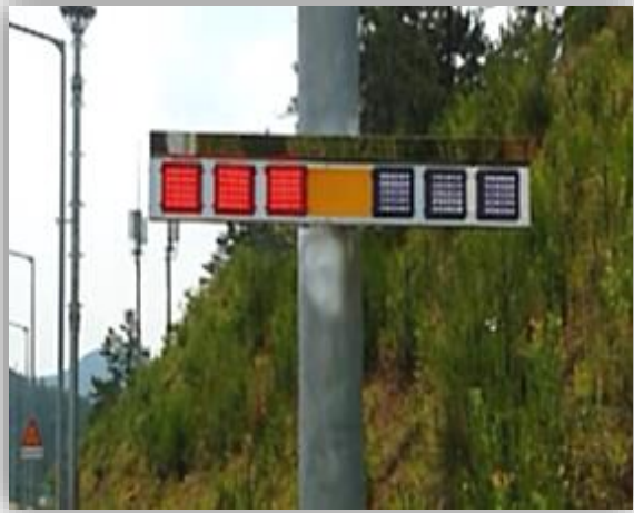
갓길 설치(가로등 충전식)