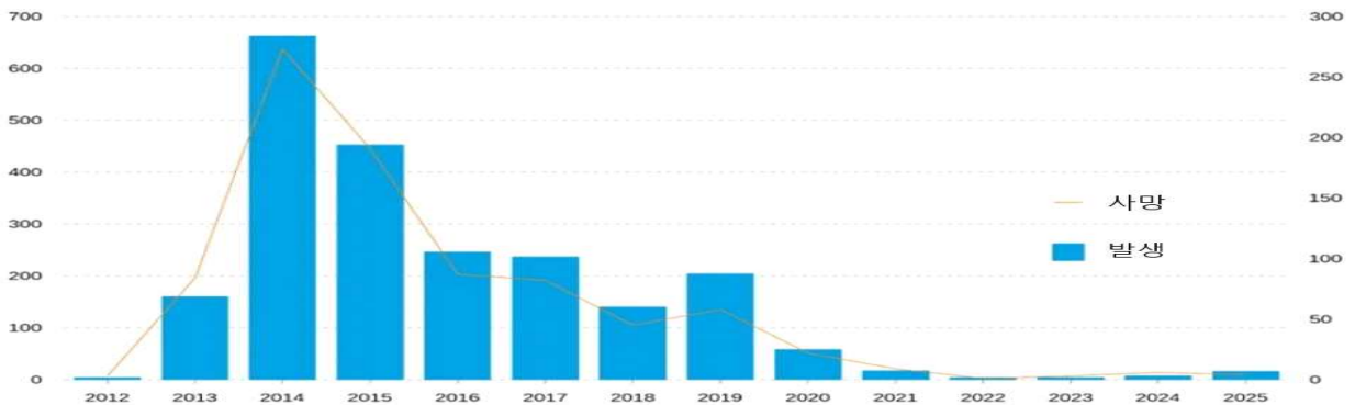
<사우디아라비아에서 보고된 메르스 확진자 및 사망자의 유행 곡선>