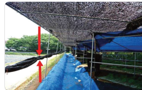
<측면 울타리 개방으로 통풍유도>