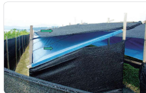
<고온기 추가 2중직 차광망 설치>