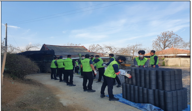
사랑의 연탄나눔 봉사활동