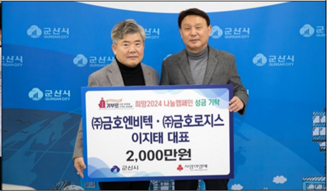
이웃돕기 성금 기탁