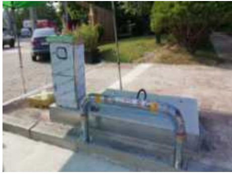
<충전시설 설치전 전경(실외)>