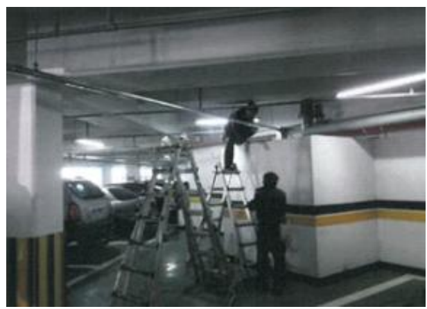
< 충전시설 설치사진 (실내) 예시 >