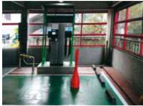
<충전시설 설치후 전경(실내)>

※ 그 밖에 전기자동차 충전설비의 설치에 관한 사항은 '한국전기설비규정 (KEC)' 241.17 참조