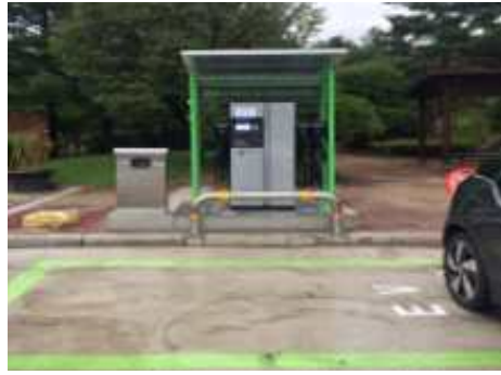
<충전시설 설치후 전경(실외)>