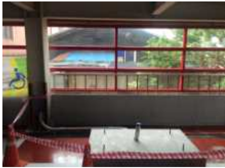
<충전시설 설치전 전경(실내)>