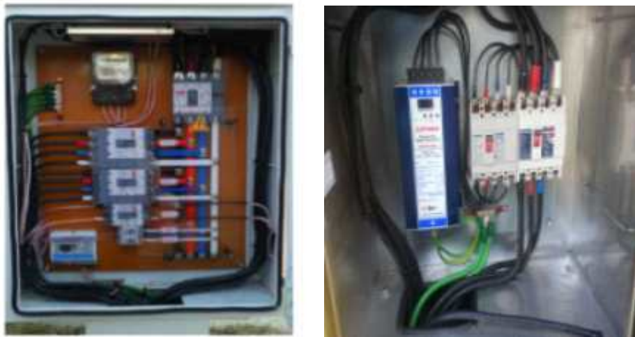
<분전반 공사 예시>