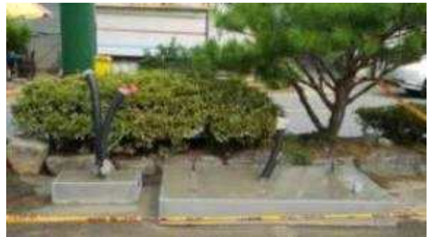
<기초 공사 (실외) 예시>