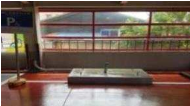
<기초 공사 (실내) 예시>